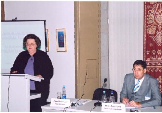
Президент Фундації "Україна-США" Надія МакКоннелл та Посол США в Україні Джон Гербст