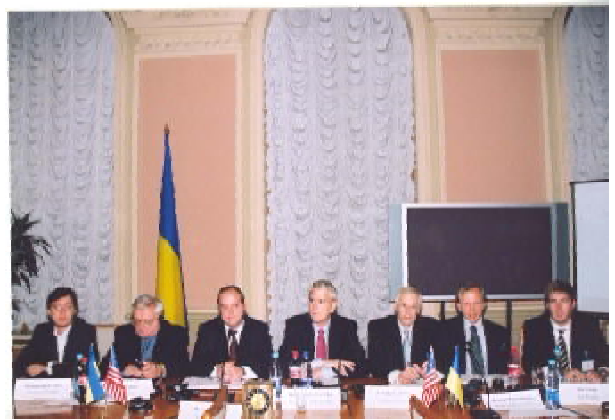
Учасники робочої групи з питань зовнішньої політики та національної безпеки