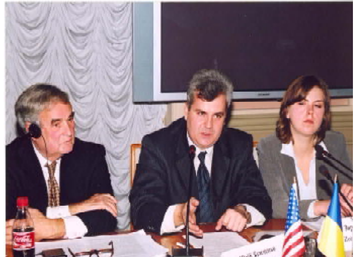
Учасники робочої групи з питань політики та урядування