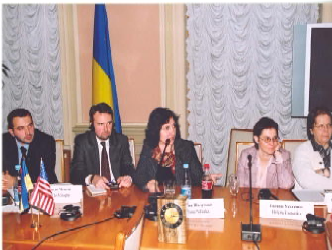
Учасники робочої групи з питань інформаційної політики та ЗМІ