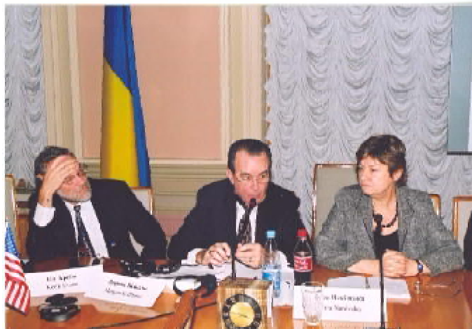
Учасники робочої групи з питань економіки та бізнесу